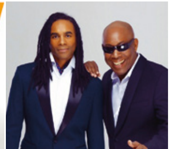
Face meets Voice – A Milli Vanilli Experience

Fahrsicherheit: Aktive Erholung und das Kennenlernen der schönen Landschaften im Bergischen Land und Ruhrgebiet stehen bei der NRW Radtour im Vordergrund. Erst mit dem Startsignal der Tourleitung beginnen die jeweiligen Teilstrecken. Wir starten, falls nicht ausdrücklich anders angekündigt, in zwei gleich großen Gruppen. Die Gruppen werden von der Polizei und den Führungsfahrzeugen sowie den ADFC-Tourscouts in den Warnwesten angeführt. Diese dürfen nicht überholt werden. An großen Gefahrenpunkten sorgt die Polizei für die entsprechende Verkehrsregelung.