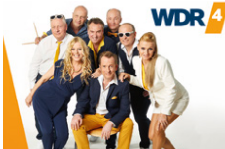
WDR 4 Band