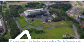
Bochum, Jahrhunderthalle, Westpark

Freitag, 21.07.2017, ca. 58 km Start: Wuppertal-Barmen, Johannes-Rau-Platz 1. Pause: Sprockhövel, Schulgebäude 2. Pause: Hattingen, Heinrichshütte Ziel: Bochum, Westpark, Jahrhunderthalle